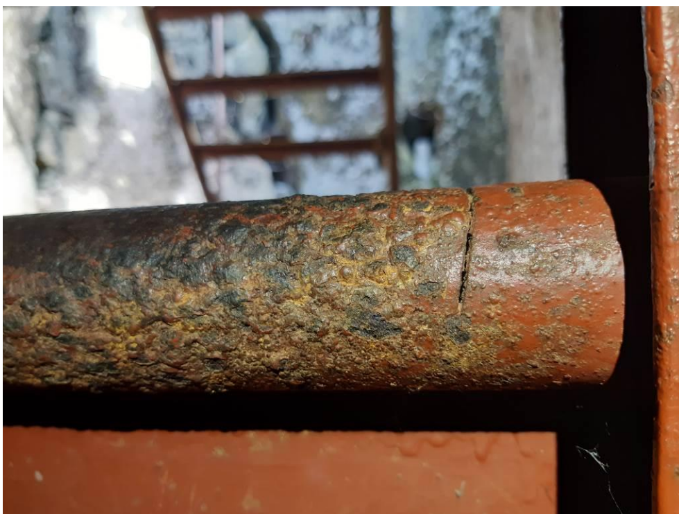
zdj. 6 – Widoczne próby przecięcia kraty.