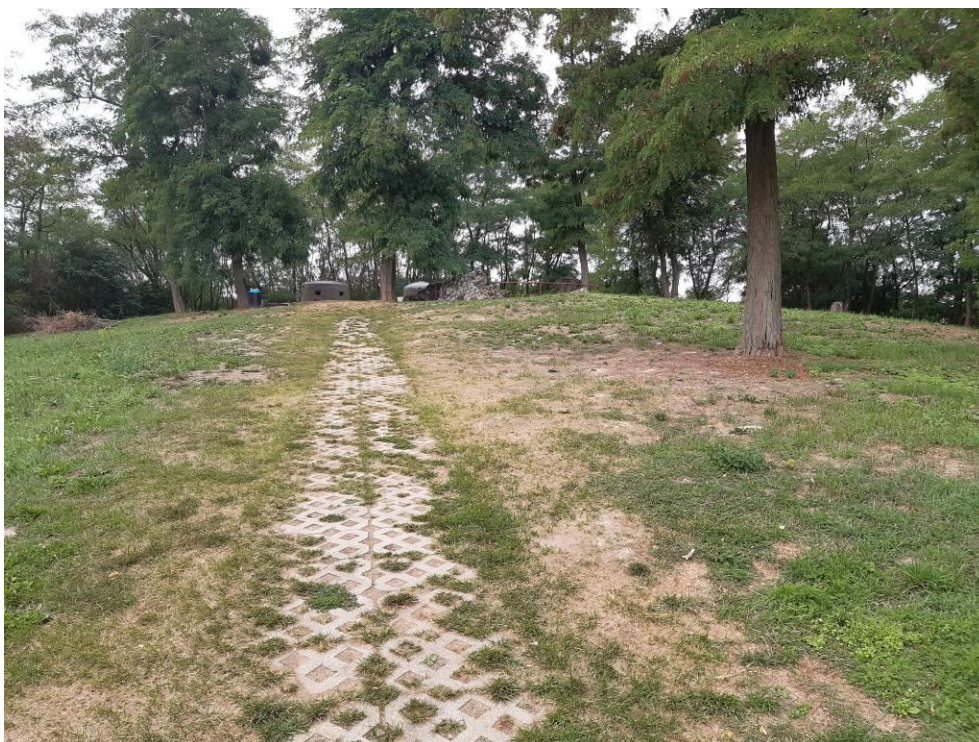
zdj. 2 – Dojście do obiektu.