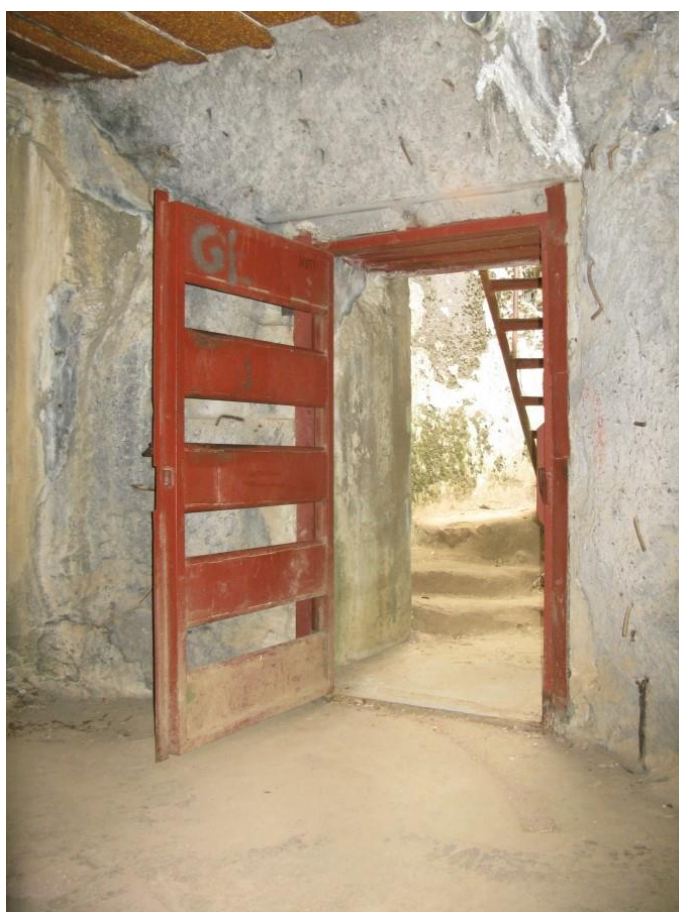
zdj. 5 – Drzwi/krata zewnętrzna.