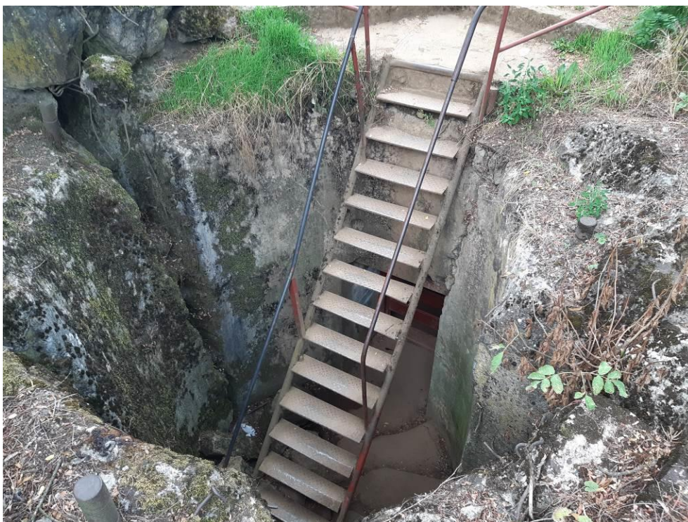
zdj. 4 – Schody prowadzące do wejścia.