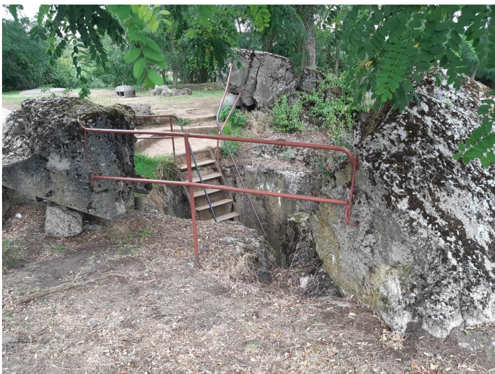
zdj. 3 – Zejście przez szyb.