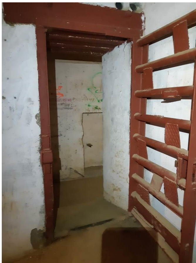
zdj. 5 – Drzwi/krata wewnętrzna – przedmiot opracowania.