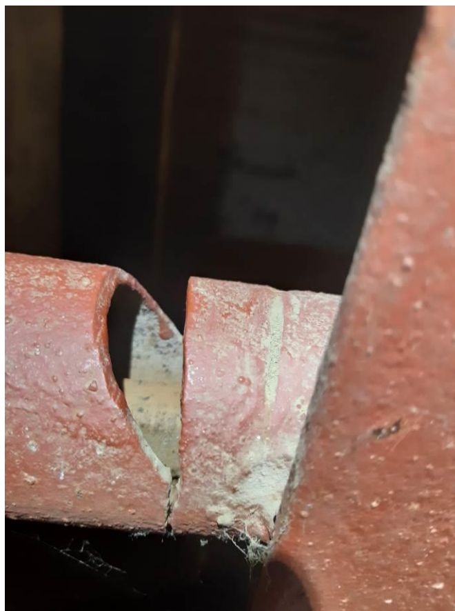
zdj. 7 – Widoczne próby przecięcia kraty.